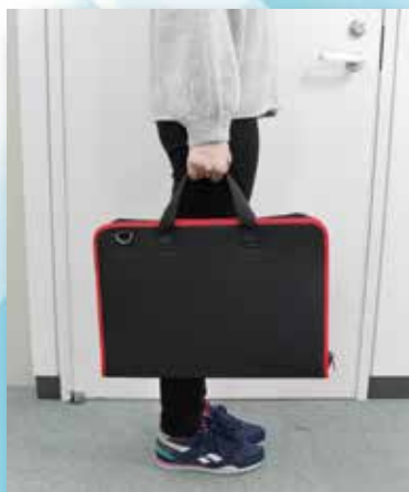
ナイロンケースは軽いので持ち運びがラクラク!